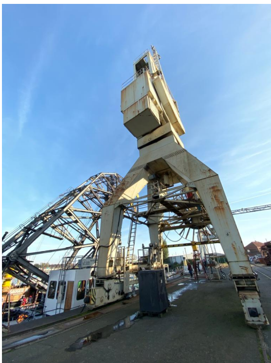
Alter Hafenkran im Holzhafen Hamburg